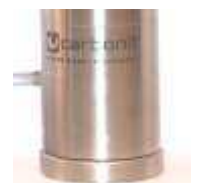
SANUNO inoxF mit Fuß

Weitere Informationen, Gutachten, Zertifikate und aktuelle Entwicklungen finden Sie im Internet unter www.carbonit.com / Mein Filter.