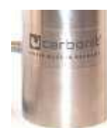
SANUNO inoxS Standard